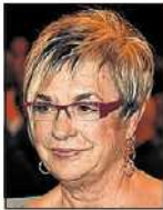
ROSALÍA MERA EMPRESARIA. 66