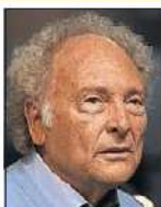
EDUARDO PUNSET COMUNICADOR. 73