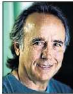
J. M. SERRAT CANTAUTOR. 66