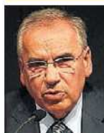
ALFONSO GUERRA POLÍTICO. 69 AÑOS