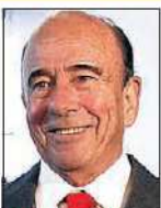
EMILIO BOTÍN PTE. SANTANDER. 75