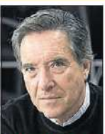
IÑAKI GABILONDO PERIODISTA. 67