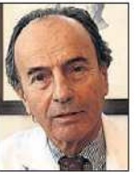
S. DEXEUS GINECÓLOGO. 74